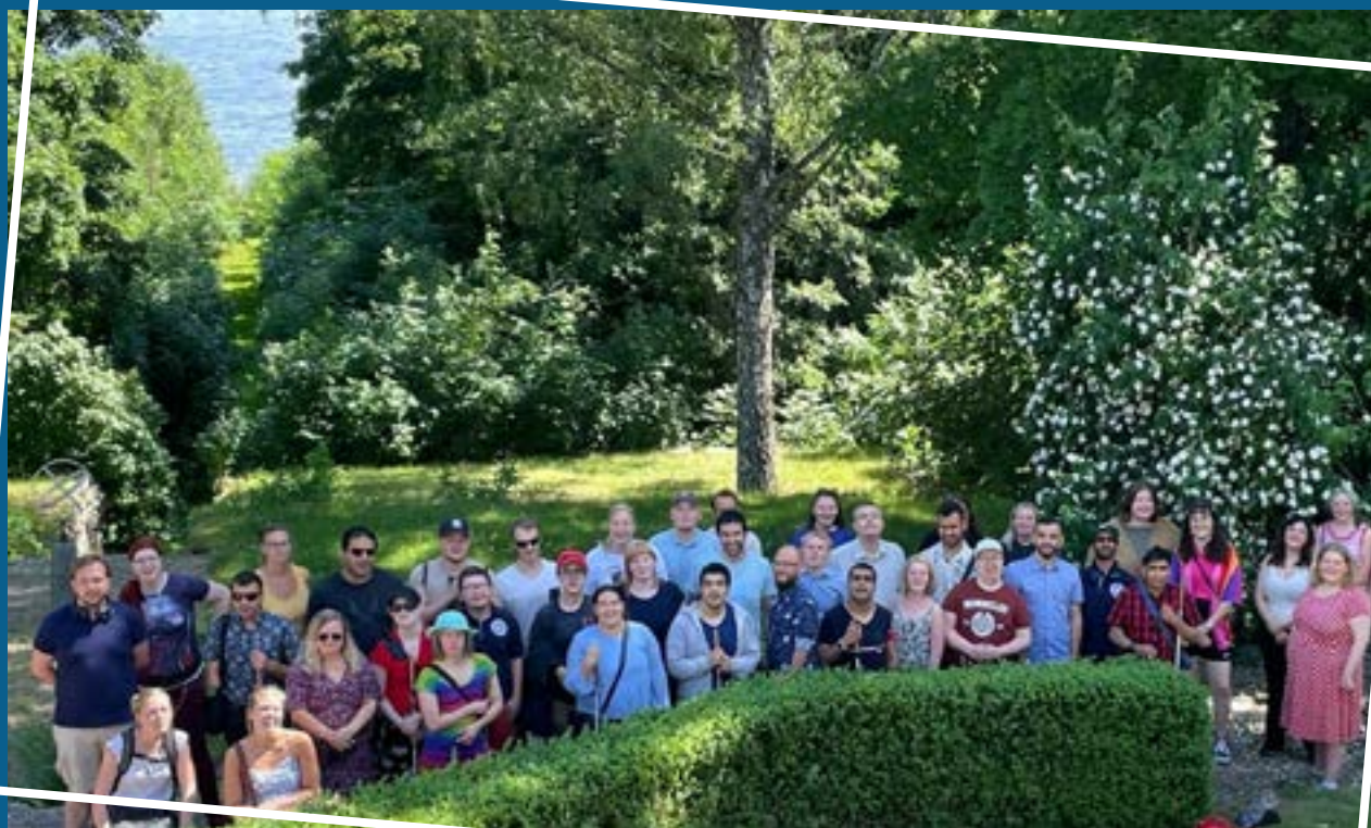
Gruppfoto från Riksstämman i Norrköping.

Riksorganisationen Unga med Synnedsättning